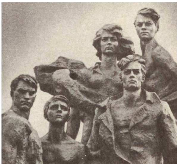
Памятник в г. Ровеньки

И клятву мы России дали, Нам без борьбы уже не жить.